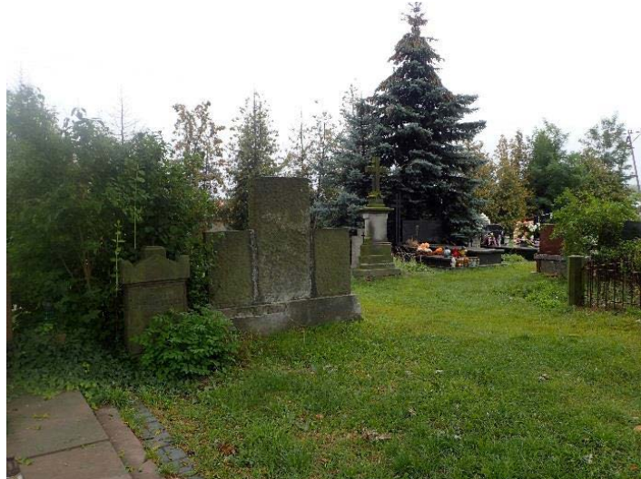
Ryc. 6. Cmentarz w Starej Iwicznej