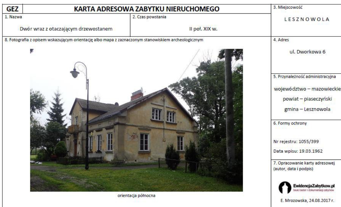
Ryc. 8. Przykładowa karta gminnej ewidencji zabytków gminy Lesznówola, awers