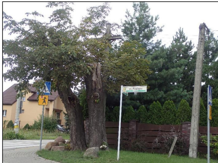
Ryc. 7. Cmentarz epidemiczny w Zgorzale

Cmentarz składa się z jednego krzyża drewnianego, umiejscowionego na rozwidleniu dróg.