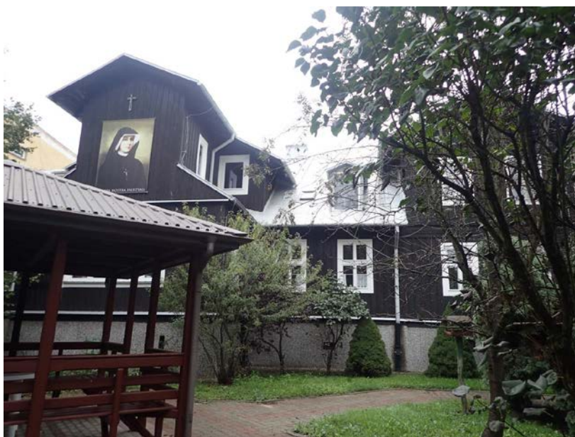
Ryc. 4. Dwór w Łazach