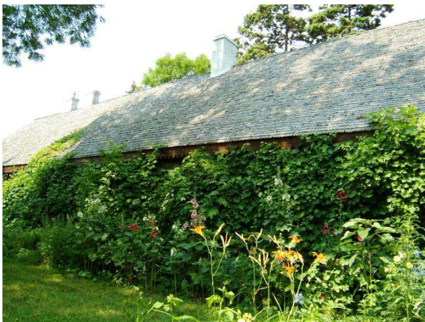
Ryc. 5. Dwór w Mrokowie