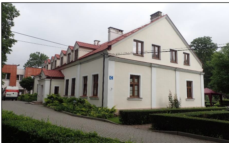
Ryc. 3. Dwór w Jastrzębcu

Do czasów wojny posiadłość nosiła nazwę Garbatka. W 1807 r. miejscowość liczyła 40 mieszkańców. Oprócz Jastrzębca w skład majątku wchodził Rosalin i Młochów. Właścicielem majątku w II poł. XIX w. był hrabia Zawisza. Dziś na terenie posiadłości działa Polska Akademia Nauk – Instytut Genetyki. Z dawnego majątku zachował się dworek po przekształceniach, park oraz zabudowania gospodarcze: stodoła, spichlerz i obora.