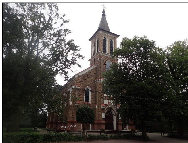
Ryc. 1. Kościół parafialny p.w. Zesłania Ducha Św. w Starej Iwicznej

Kościół pierwotnie ewangelicki, został zbudowany na miejscu wcześniejszego w 1893 r. Ze źródeł wiadomo, że pierwszy kościół powstał w 1843 r. Założony na rzucie prostokąta, z prezbiterium wydzielonym, zamknięty prosto z kruchtą, 3 kondygnacyjny,