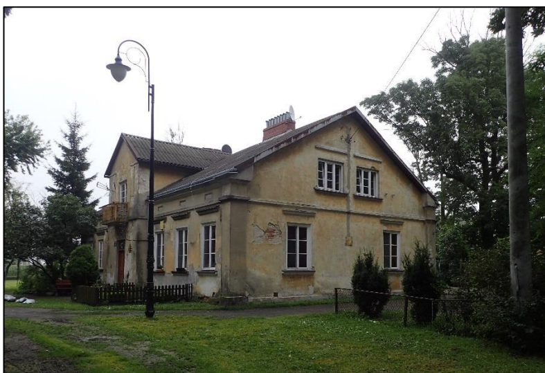
Ryc. 2. Dwór wraz z otaczającym drzewostanem w Lesznowoli