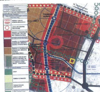
GRANICA OBSZARU OPRACOWANIA